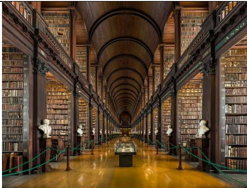
Long Room Interior, Trinity College Dublin, Ireland