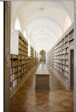
Archives nationales (Paris) la galerie du Parlement (Grands Dépôts)